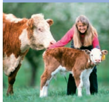
Wenn Stadtkinder Landluft schnuppern – auf dem Bauernhof lernen Jugendliche beim FÖJ die nachhaltige Landwirtschaft kennen

Besonders die Möglichkeit, den freiwilligen Einsatz mit konkreten praktischen Erfahrungen in einem beruflichen Umfeld zu verbinden, ist für viele Jugendliche verlockend. Auch wenn das FSJ und das FÖJ in erster Linie ein soziales und ökologisches Bildungsjahr sind, so haben die Freiwilligendienste doch auch einen Bezug zur Arbeitswelt und zur beruflichen Orientierung und Qualifizierung. Studien belegen,