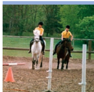
Kinder- und Jugend-Reit- und Fahrverein Berlin-Zehlendorf

Für Yanin hat es sich bereits ausgezahlt. Die 19-Jährige arbeitet beim Kinder- und Jugend-Reit- und Fahrverein Berlin-Zehlendorf. Dort betreut sie Reitanfängerinnen und Reitanfänger ab drei Jahren und kümmert sich um das Wohl der Pferde. Danach will sie Pferdewirtin werden. Das freiwillige Jahr kann sie sich dann auf die dreijährige Ausbildung anrechnen lassen. Und einen Ausbildungsplatz hat sie schon sicher – durch die Kontakte im Verein. „Eine richtige Erfolgsgeschichte“, freut sich der zuständige Jugendreferent beim Landessportbund Berlin.