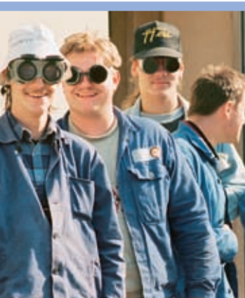
Jung sein hat viele Aspekte: mal abhängen, mal Spaß haben ...

Die Freiwilligendienste verzeichneten in den vergangenen Jahren eine ständig steigende Nachfrage. So wurden mit finanzieller Unterstützung der Bundesregierung die Angebote für ein Freiwilliges Soziales und ein Freiwilliges Ökologisches Jahr ständig erweitert und die wichtige pädagogische Begleitung sichergestellt. Waren es 1993 noch rund 7.100 Jugendliche, die sich für ein Freiwilliges Soziales Jahr entschieden, so liegt 2008 die Gesamtzahl in beiden Diensten bei mehr als 18.600 jungen Menschen, zuzüglich ca. 5.700 Freiwilligen nach § 14c Zivildienstgesetz (ZDG). Diese positive Entwicklung hat eine Ursache. Die Freiwilligendienste treffen bei vielen Jugendlichen ein Grundbedürfnis: ein Orientierungs- oder ein Bildungsjahr nach der Schule zu nehmen, die Verantwortung für das eigene Leben und auch Verantwortung für andere zu übernehmen.